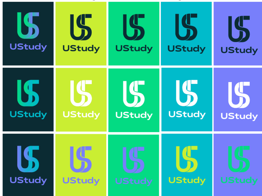
Figura 4 – Variantes da logo

Para termos possibilidade de aplicação em diversos contextos, fizemos diferentes versões seguindo a paleta de cores: