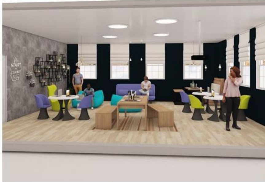
Figura 9 – Vista do Laboratório pela frente