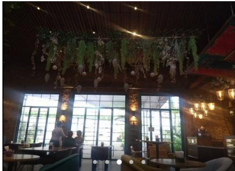
Figura 8 – Recafé