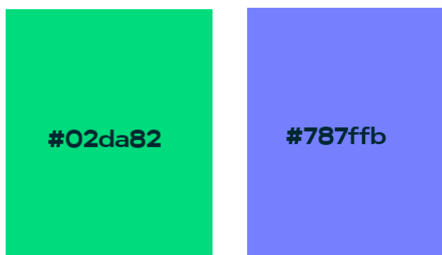
Figura 7 – Cores principais

As cores principais são o 'Verde-água' e o 'Lilás'. Cores que foram utilizadas para remeter a Universidade Barão de Mauá: