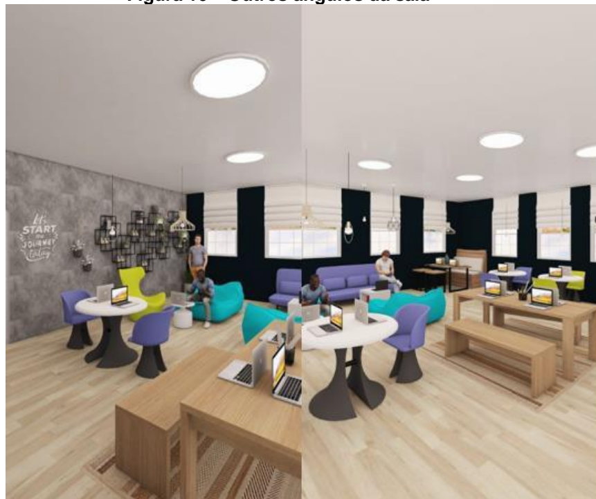
Figura 10 – Outros ângulos da sala