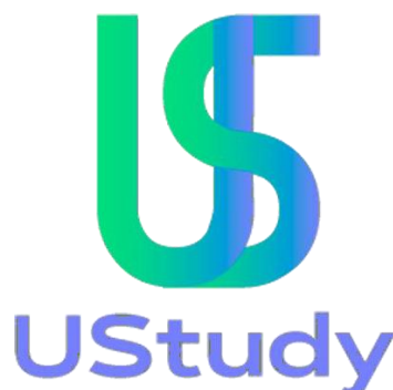
Figura 2 – Logotipo final

Chegamos à conclusão que esse esboço não trazia da melhor forma possível a ideia que tínhamos sobre o conceito. Então decidimos “entrelaçar” as letras e utilizar o degradê para remeter ao logotipo da Barão de Mauá. Chegamos nesse resultado: